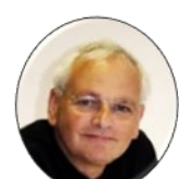
International Council for adult education Alan TUCKETT, President ICEA